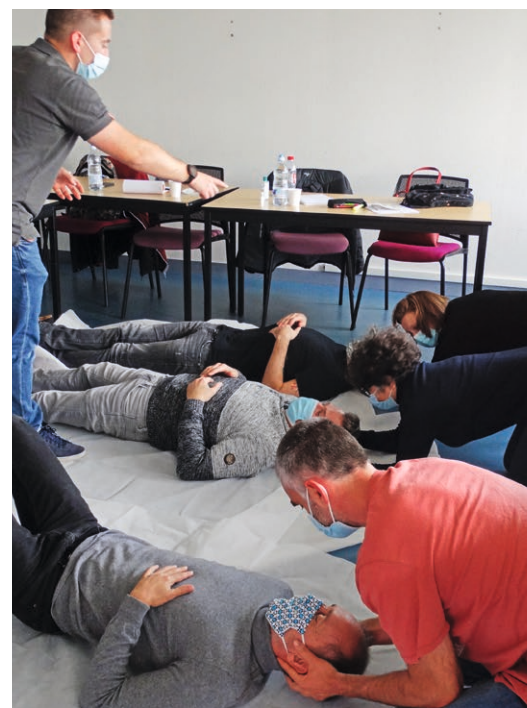
Formation aux premiers gestes de secours.

Dans le cadre de sa démarche Qualité, le SATESE 37 est resté à l'écoute des évaluations, commentaires et réflexions formulés par ses adhérents. Ce processus, véritable pilier de la performance du syndicat, s'est réalisé au travers de la classique